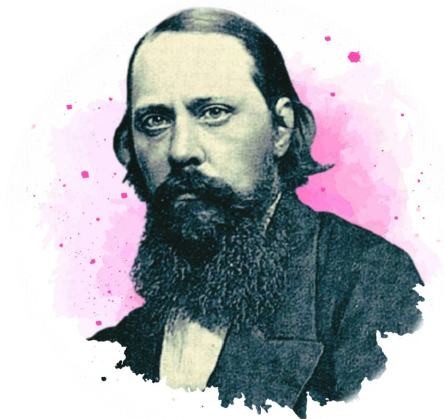
Михаил Евграфович Салтыков-Щедрин

А. Ухтомский называл Салтыкова-Щедрина Сократом русской общественной мысли, Г. Успенский радетелем о русской земле, А. Островский – римским пророком, И. Сеченов – прокурором русской общественной жизни и защитником России от врагов внутренних. Л. Толстой писал ему: «У Вас есть всё, что нужно – сжатый, сильный, настоящий язык, характерность, оставшаяся у Вас одних <...> и по содержанию – любовь и потому знание истинных интересов жизни народа».