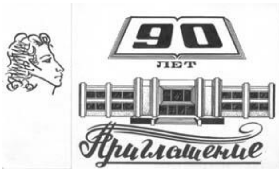
Приглашение на 90-летний юбилей библиотеки

Библиотека продолжала свой рост, и, казалось бы, всё складывается хорошо. Но одно событие всё же, омрачало её существование. Речь идёт о затянувшемся ещё с 1974 г. строительстве нового здания для главной библиотеки республики. С такими невесёлыми мыслями общественность Дагестана отметила в 1990 г. 90-летний юбилей главного книгохранилища. К юбилею фонд с библиотеки оставил около 900 тысяч. Её ежегодно посещало более 20 тысяч читателей, которых обслуживало почти 80 библиотечных работников, более половины которых, с высшим образованием.