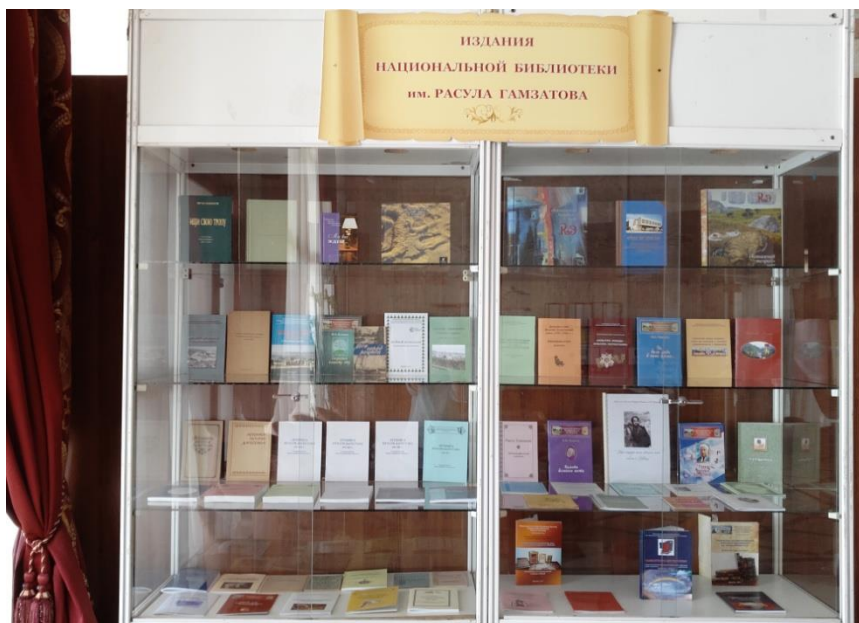
Выставка изданий библиотеки за разные годы

Регулярно издаются информационные бюллетени о новых поступлениях литературы и тематические указатели изданий по различным отраслям знания, имеющихся в библиотеке. Издательская деятельность представлена также методико-библиографическими пособиями, рекомендациями, консультациями в помощь библиотекам республики.