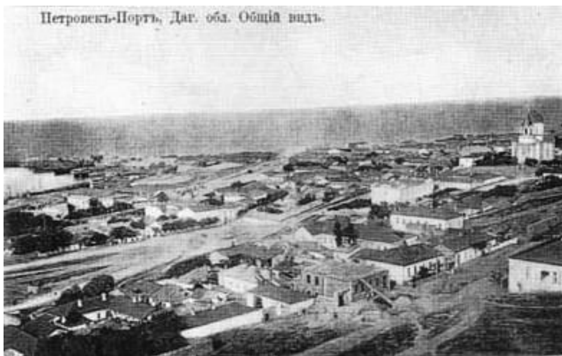
г. Порт-Петровск. Дагестанская область. Общій вид

К началу 1900 г. в городе Порт-Петровск не было, согласно «Обзору Дагестанской области», учёных обществ, музеев, публичных библиотек, периодических изданий. Население города в 1900 г. составляло 13 671 человек.