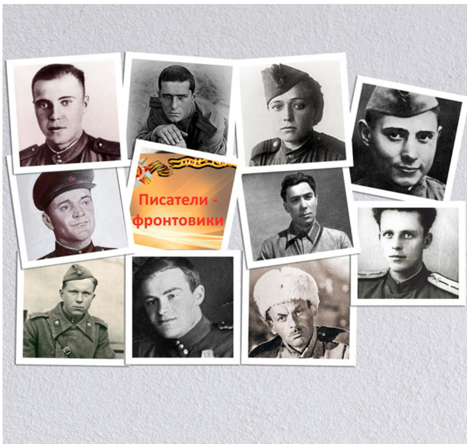
Коллаж из военных фото писателей-фронтовиков, представленных в информационно-методическом материале «Я расскажу вам о войне...».